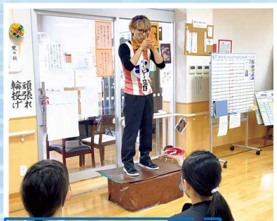
マジックショー(職員)