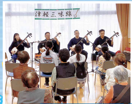
津軽三味線コンサート