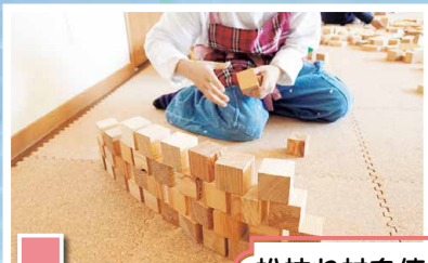
松枯れ材を使った積み木のコーナー