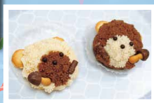
ご利用者手作りのおみやげ