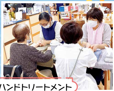
ハンドトリートメント