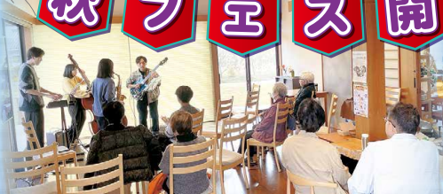
信州大学JAZZ研究会の生演奏