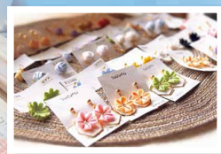
各種ワークショップ