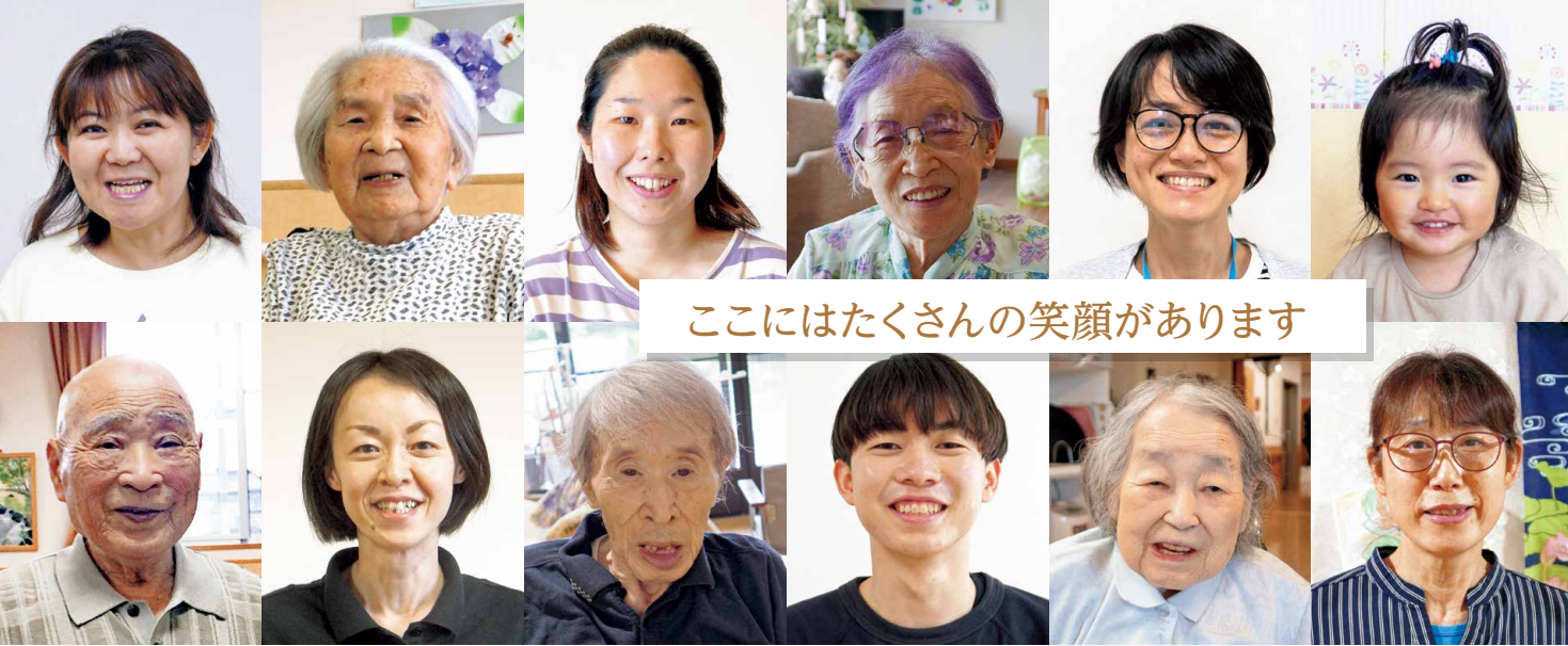
ここにはたくさんの笑顔があります