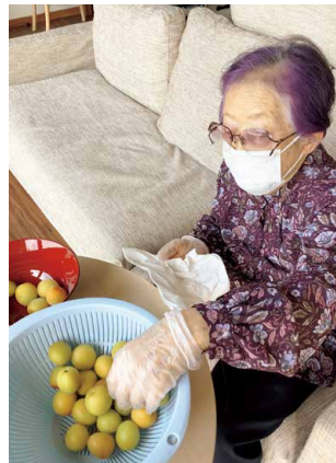
梅ジュース作り 1か月後が楽しみです。