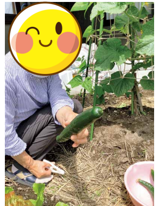
庭の畑でとれたきゅうり。 他にもいろいろなものを育ててます。